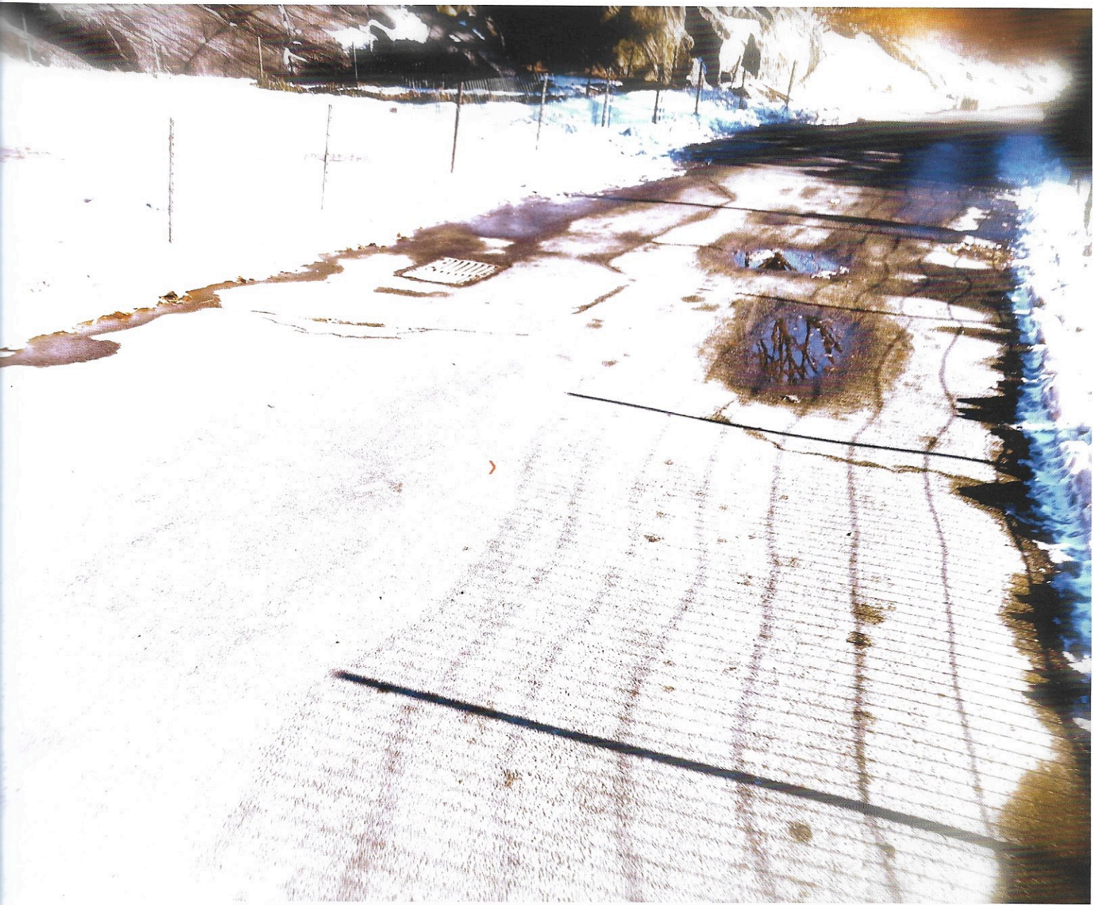
Intempéries 5 , 2014, fotografía digital, 90 x 60 cm.