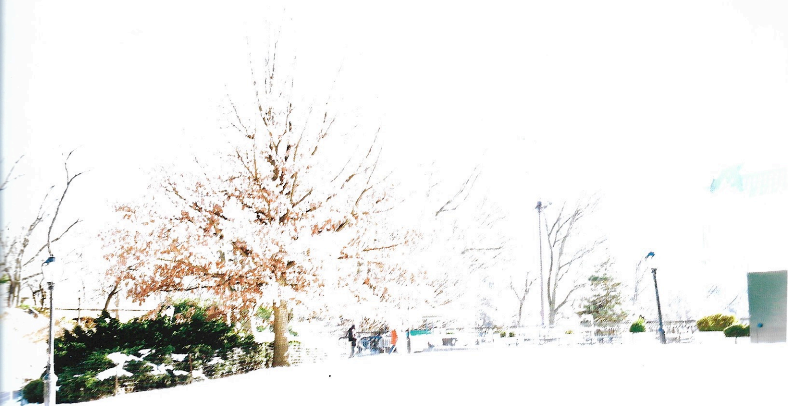
Intempéries 3 , 2014, fotografia digital, 90 x 60 cm.