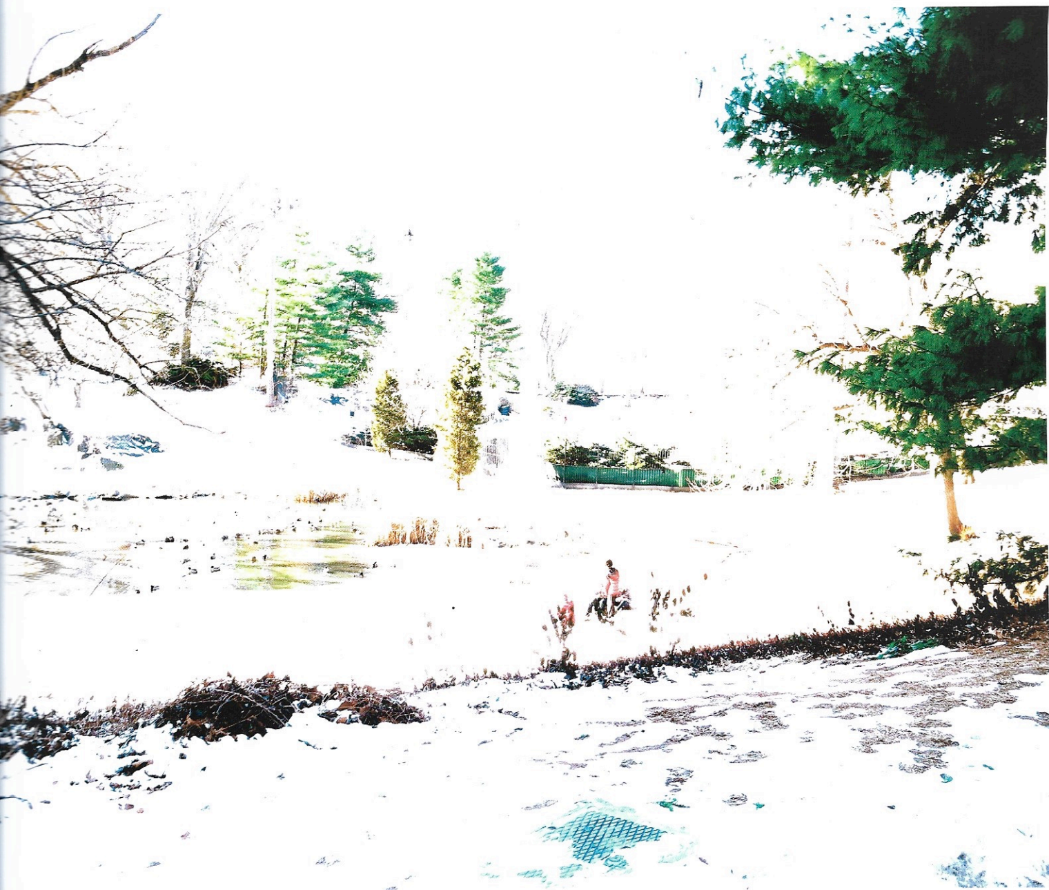
Intempéries 1 , 2014, fotografia digital, 90 x 60 cm.